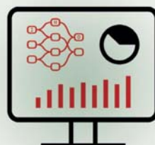
TÜV AUSTRIA Bericht erhalten