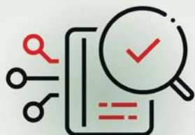
Daten verifizieren lassen